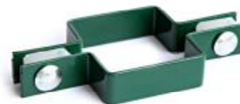
Крепление: позволяет исполнять углы поворота ограждений на любой градус без дополнительного столба.