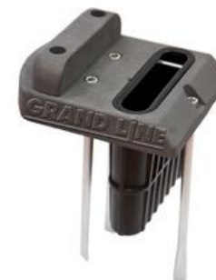
Фиксатор для ригелей: бетонируется в месте стыка двух створок распашных ворот и фиксирует створки ворот в закрытом состоянии.