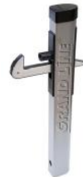
Фиксатор створки ворот: бетонируется на нужную высоту и удерживает створки ворот или калиток в открытом состоянии.