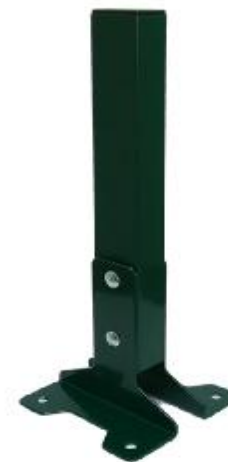
Основание для столба