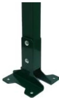
Основание для столба монтируется с помощью болтов М6*85, комплект из 2-х шт.