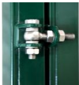
Петли регулируемые от 20 до 50 мм Угол открывания 180°