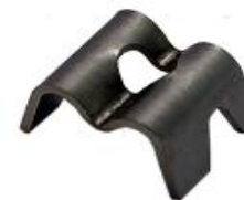
Клипса соединительная из нержавеющей стали