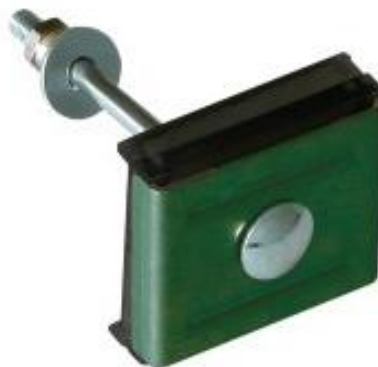
Крепление: скоба, болт М6, гайка антивандальная и шайба