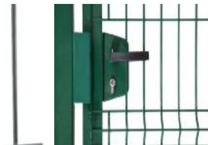
Замок с ручкой