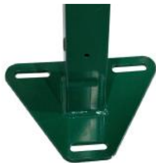
Столб с приваренным основанием треугольной формы для монтажа на винтовые опоры или прямоугольной формы для монтажа на фундамент