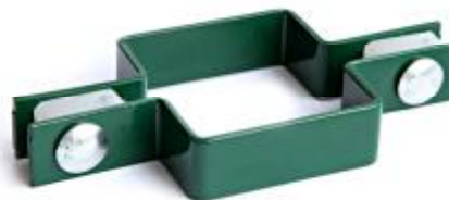
Крепление: позволяет исполнять углы поворота ограждений на любой градус без дополнительного столба.

Возможно производство в других цветах RAL под заказ.