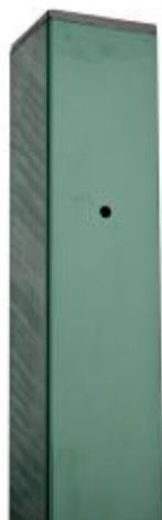
Столб оцинкованный с отверстиями