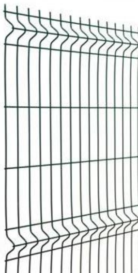
Панель сварная оцинкованная