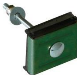
Крепление: скоба, болт М6, антивандальная гайка