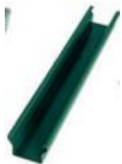
Стойка 84*48*2500/3000 мм толщина 1 мм покрытие Granite®HDX (двс)