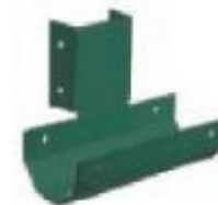
T-кронштейн толщина 1,4 мм покрытие Zn или полимерное покрытие