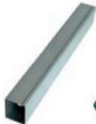
Столб 62*55*2500/3000 мм толщина 1,4 мм покрытие Zn или полимерное покрытие