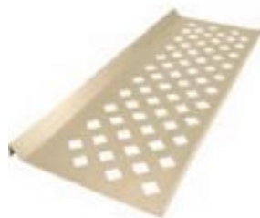
Декоративное полотно толщина 0,5 мм полимерное покрытие