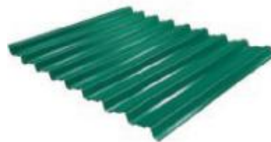
Панель Премиум 860*1600/1970 мм толщина 0,5 мм покрытие полиэстер двс