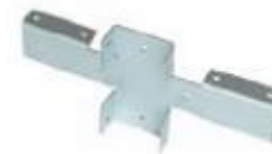
X-кронштейн толщина 1,4 мм покрытие Zn или полимерное покрытие