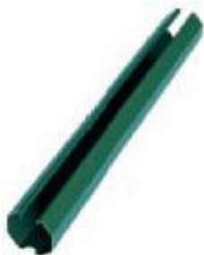
Направляющая 60*20*2500 мм толщина 1 мм покрытие Granite®HDX (двс)