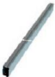
Труба 40*20*2500/3000 мм толщина 1 мм покрытие Zn или полимерное покрытие