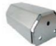
L-кронштейн толщина 1,4 мм покрытие Zn